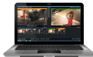
Live Production Software